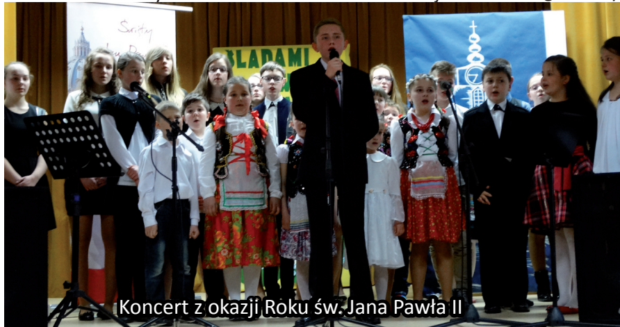
Koncert z okazji Roku św. Jana Pawła II

W kwietniu przeżyaliśmy dziesiątą rocznicę śmierci i pierwszą rocznicę kanonizacji Ojca Świętego Jana Pawła II. Obchody Roku św. Jana Pawła II w naszej