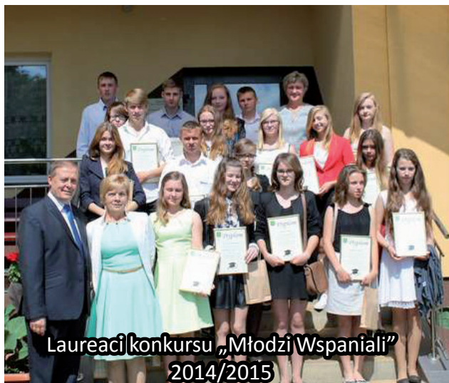
Laureaci konkursu „Młodzi Wspaniali” 2014/2015