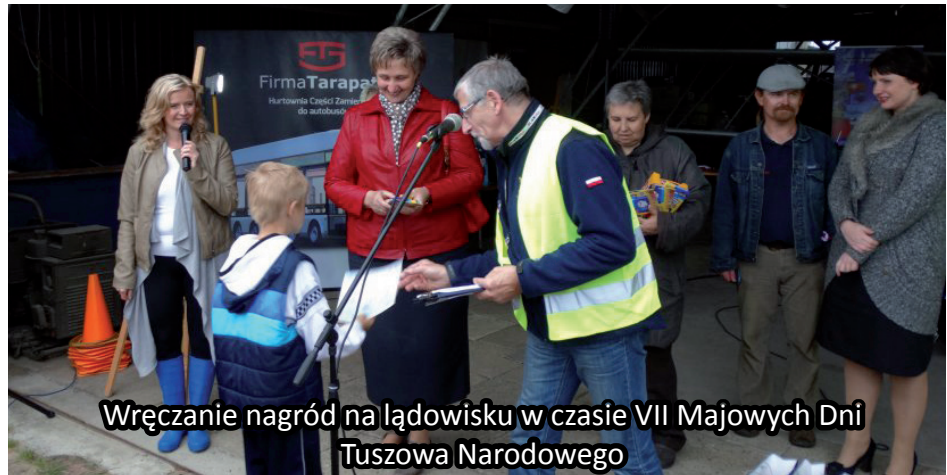
Wręczenie nagród na lądowisku w czasie VII Majowych Dni Tuszowa Narodowego