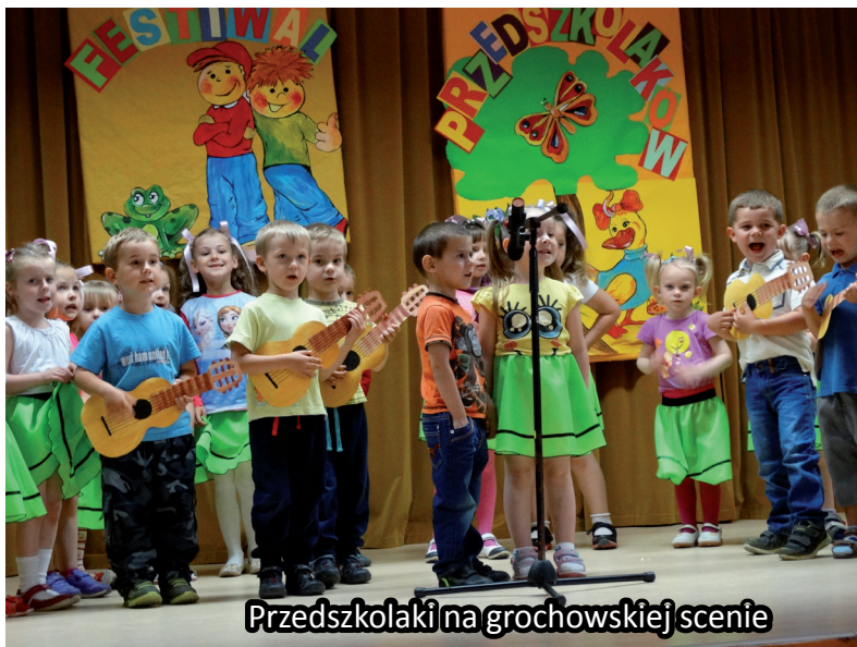
Przedszkolaki na grochowskiej scenie

22 kwietnia młodsze dzieci z zespołów artystycznych Domu Kultury wyjechały na wycieczkę do Łańcuta. Celem wycieczki była zaplanowana w zamku edukacyjna lekcja historii „W teatrze cieni”, a następnie zwiedzanie pomieszczeń Zamku Lubomirskich i Potockich wraz z zabudowaniami i ściśle niegdyś związanymi z życiem