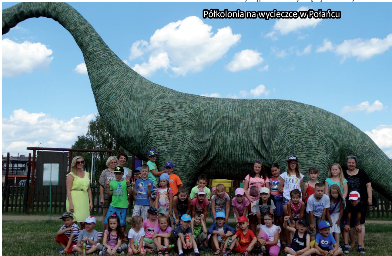
Półkolonia na wycieczce w Połańcu