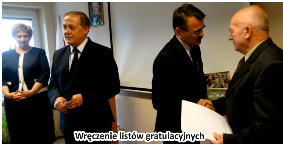
Wręczenie listów gratulacyjnych