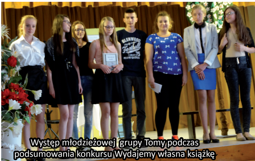
Występ młodzieżowej grupy Tomy podczas podsumowania konkursu Wydajemy własną książkę