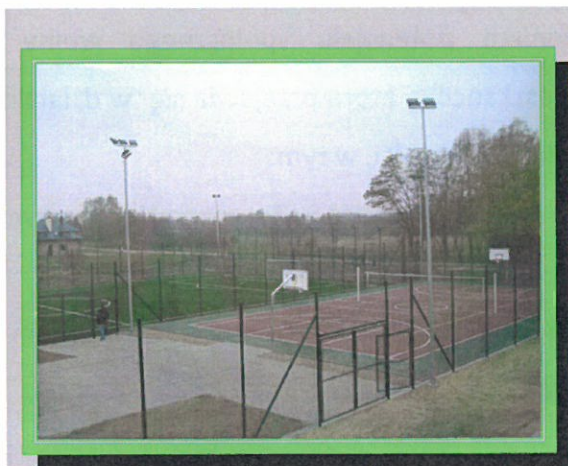
Kompleks boisk „Orlik” w Jaślanach.