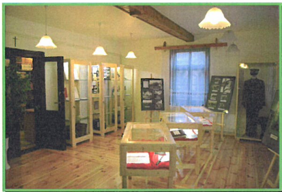
Centrum Pamięci gen. W.E. Sikorskiego