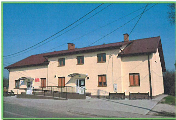
Dom Ludowy w Jaślanach.