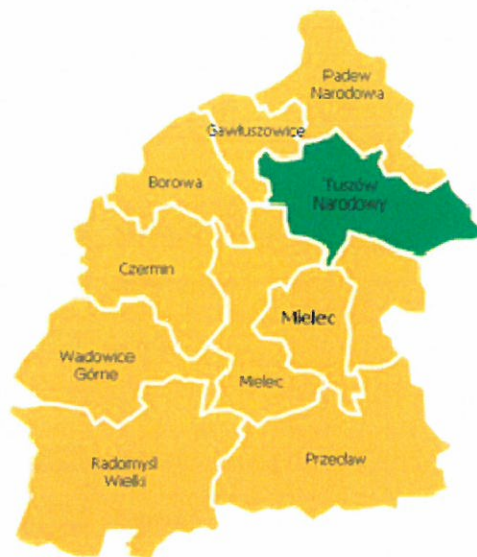
Mapa powiatu mieleckiego.

Gmina Tuszów Narodowy jest jedną z 10 gmin należących do powiatu mieleckiego. Położona jest w północno-zachodniej części województwa podkarpackiego, na terenie Kotlinie Sandomierskiej. Gmina od strony północnej graniczy z Gminą Padew Narodowa, od wschodu z Gminą Cmolas, na południu sąsiaduje z Gminą Mielec i miastem Mielec, a od strony zachodniej z Gminą Gawłuszowice.