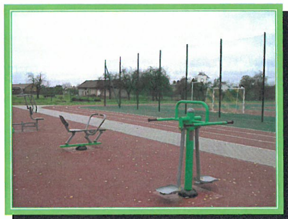
Wielofunkcyjne boisko w Tuszowie Narodowym

W każdej miejscowości (wyjątek stanowią Pluty i Tuszów Mały), działają jednostki Ochotniczej Straży Pożarnej (łącznie 13).