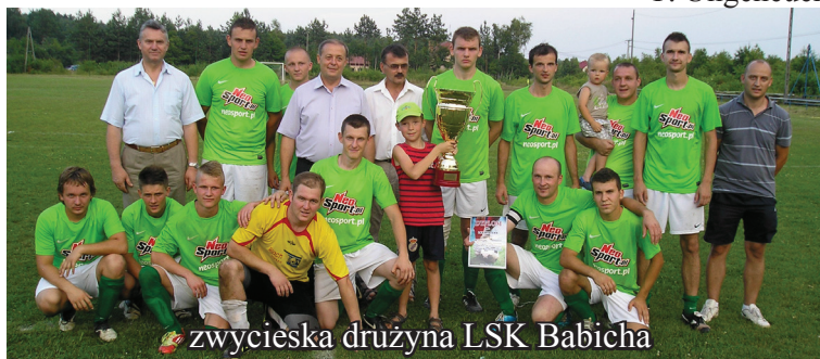
zwycięska drużyna LSK Babicha