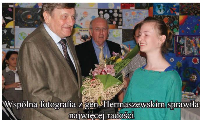
Wspólna fotografia z gen. Hermaszewskim sprawiła najwięcej radości