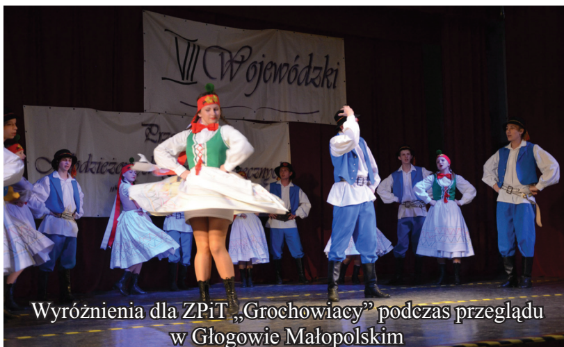
Wyróżnienia dla ZPiT „Grochowiacy” podczas przeglądu w Głogowie Małopolskim

Wyróżnienia dla ZPiT „Grochowiacy” w Podkarpackich Przeglądach Dziecięcych i Młodzieżowych Zespołów Tanecznych w Dębicy (17 marca) i Głogowie Małopolskim (21 kwietnia) Zespół prezentował się w młodzieżowej kategorii, tańcząc konkursowo suitę tańców krośnieńskich. Z przeglądów wróciliśmy zadowoleni i bogatsi o nowe doświadczenia.