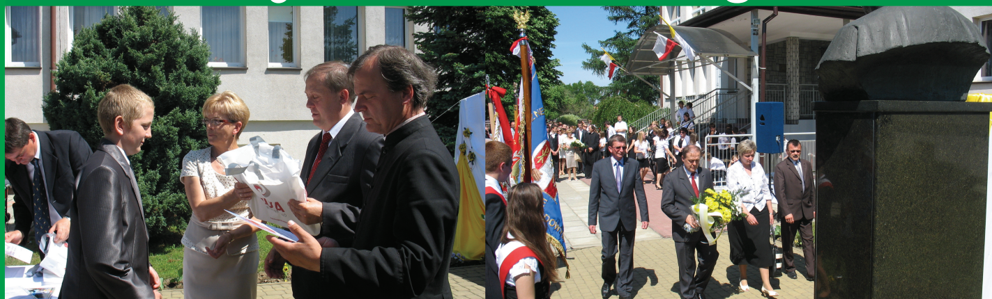
Dzień Papieski- uroczystości na placu przed gimnazjum