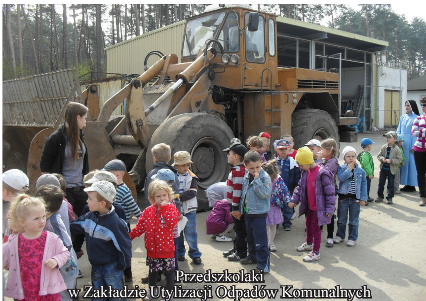
Przedszkolaki w Zakładzie Utylizacji Odpadów Komunalnych