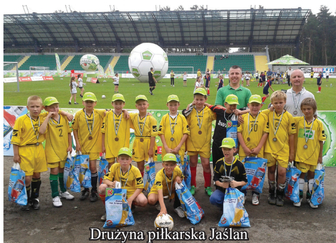
Drużyna piłkarska Jaślan

Bardzo dobrze spisali się młodzi piłkarze klas I-III z Jaślan w oficjalnych mistrzostwach Polski U-10, organizowanych przez Polski Związek Piłki Nożnej, a sponsorowany przez firmę Tymbark. W I etapie w turnieju gminnym wygrali z drużynami z Czajkowej i Malinia, awansując do półfinału powiatowego, gdzie nie dali żadnych szans zespołom z Rzędzianowic (13-0) i Padwi Narodowej (2-0).