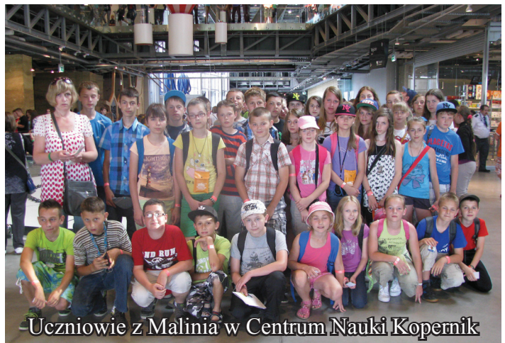
-Uczniowie z Malinia w Centrum Nauki Kopernik