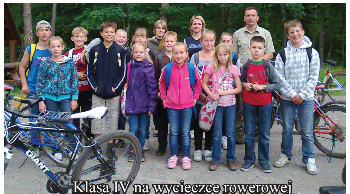
Klasa IV na wycieczce rowerowej

26 czerwca odbyła się wycieczka rowerowa klasy IV ścieżką przyrodniczo - edukacyjną „ Trześć ”.