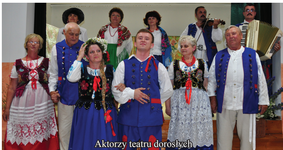
Aktorzy teatru dorosłych

w folklorze”. Prezentacje konkursowe odbywały się w 5 kategoriach wykonawczych tj. soliści, grupy śpiewacze, grupy obrzędowe, instrumentalni i zespoły taneczne. W festiwalu udział wziął Zespół Pieśni i Tańca „Grochowiacy” z Wiejskiego Domu Kultury i Rekreacji w Grochowie, który zaprezentował się w kategorii zespołów tanecznych. Tańcząc wiązanek tańców z regionu rzeszowskiego oraz suitę tańców krośnieńskich, wytańczył nagrodę, zdobywając III miejsce. Do tańca zespołowi przygrywali z wielką pasją muzycy z kapeli „Grochowiacy”.