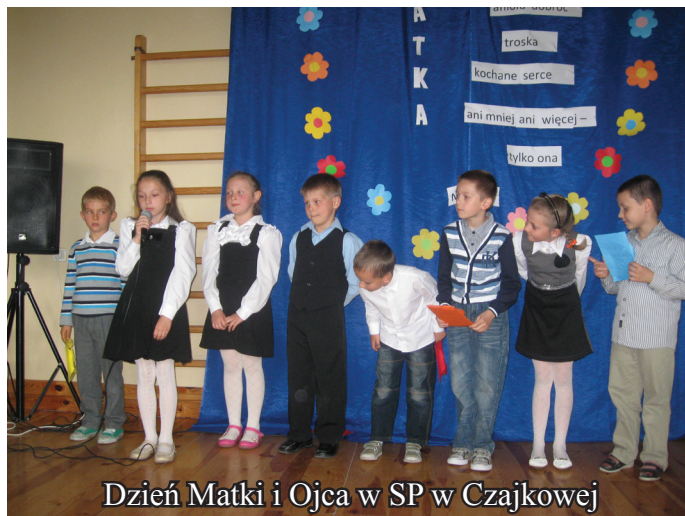
Dzień Matki i Ojca w SP w Czajkowej

i tańcem wyrazili miłość do swoich rodziców. Wszystkie dzieci swobodnie prezentowały swoje umiejętności artystyczno – wokalne. Rodzice byli zachwyceni występami swoich pociec. Uczniowie również złożyli rodzicom podziękowania, życzenia i wręczyli kwiaty oraz laurki.