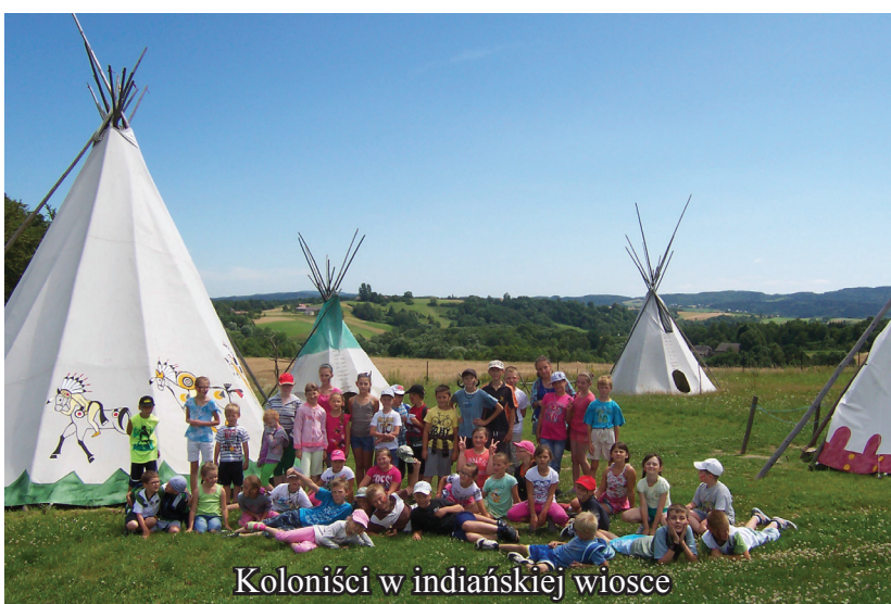
Koloniści w indiańskiej wiosce

w folklorze”. Prezentacje konkursowe odbywały się w 5 kategoriach wykonawczych tj. soliści, grupy śpiewacze, grupy obrzędowe, instrumentalni i zespoły taneczne. W festiwalu udział wziął Zespół Pieśni i Tańca „Grochowiacy” z Wiejskiego Domu Kultury i Rekreacji w Grochowie, który zaprezentował się w kategorii zespołów tanecznych. Tańcząc wiązanek tańców z regionu rzeszowskiego oraz suitę tańców krośnieńskich, wytańczył nagrodę, zdobywając III miejsce. Do tańca zespołowi przygrywali z wielką pasją muzycy z kapeli „Grochowiacy”.