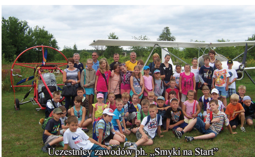
Uczestnicy zawodów ph. „Smyki na Start”

Półkolonia letnia to propozycja dla dzieci, które wakacje spędzały w miejscu zamieszkania. Dom Kultury w Grochowie przy pomocy finansowej Urzędu Gminy w Tuszowie Narodowym od kilku już lat organizuje tę formę wypoczynku dla dzieci z terenu naszej gminy. W tym roku półkolonia zlokalizowana była w Zespole Szkół w Jaślanach w dniach od 15 do 26 lipca. Uczęszczało na nią 47 dzieci w wieku od 6 do 11 lat. Organizatorzy