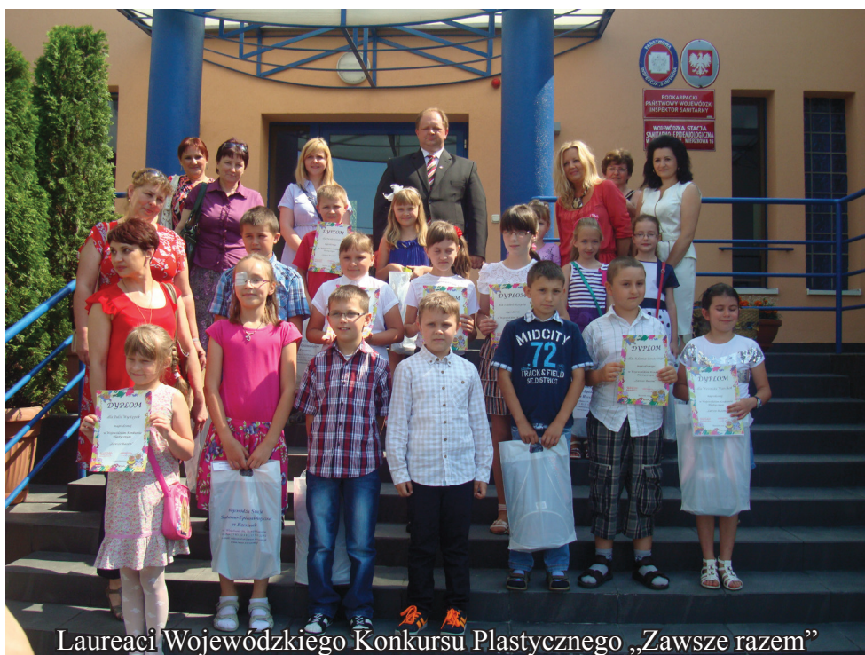
Laureaci Wojewódzkiego Konkursu Plastycznego „Zawsze razem”