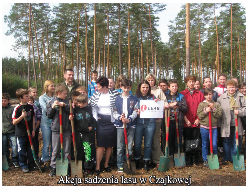
Akcja sadzenia lasu w Czajkowej

29 kwietnia w ramach współpracy z firmą LEAR z Mielca oraz Nadleśnictwem Mielec odbyła się akcja sadzenia drzew w miejsce spalonego lasu w Leśnictwie Czajkowa. W akcji sadzenia brali udział uczniowie naszej szkoły z klas IV – VI z wychowawcami oraz panią dyrektorem. Firma ta była sponsorem poczęstunku dla naszych dzieci, za co kierujemy do nich serdeczne podziękowania.