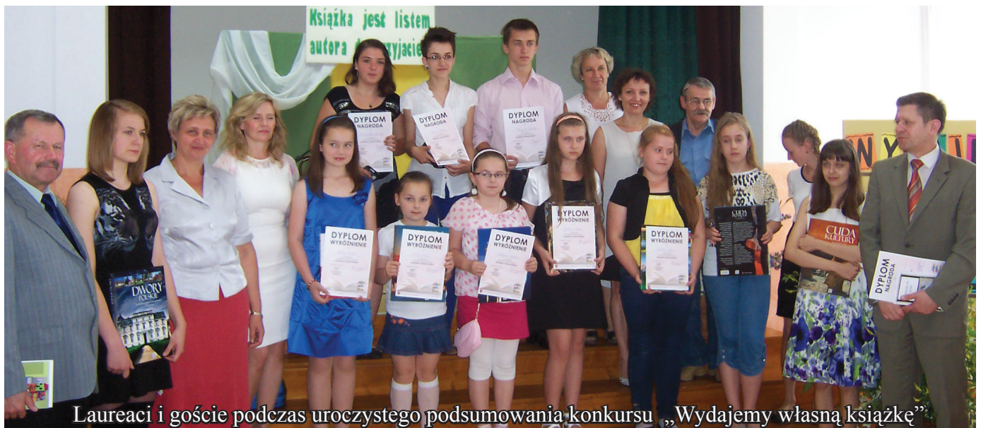
Laureaci i goście podczas uroczystego podsumowania konkursu „Wydajemy własną książkę”