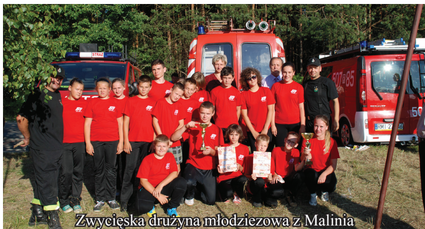
Zwycięska drużyna młodzieżowa z Malinia