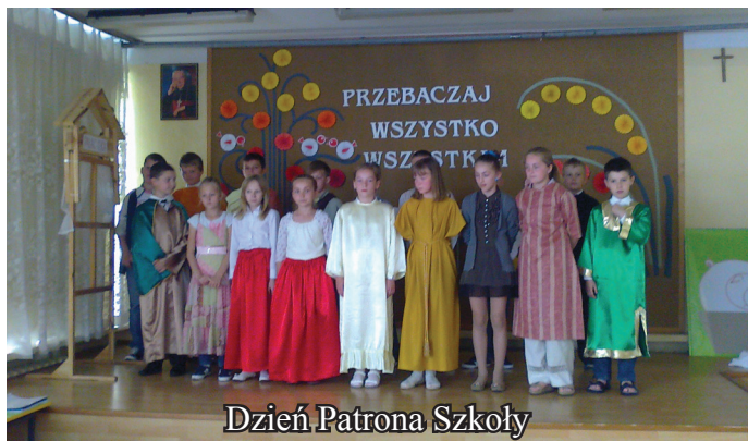
Dzień Patrona Szkoły

7 czerwca w szkole w Maliniu było szczególnie uroczyste. Zebrani w auli uczniowie i nauczyciele z uwagą wysłuchali przygotowanego specjalnie na tę okazję montażu słowno – muzycznego. Mieli okazję przypomnieć sobie najważniejsze fakty z życia Kardynała