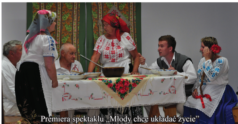
Premiera spektaklu „Młody chce układać życie”