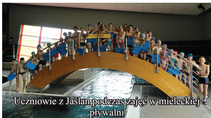
Uczniowie z Jaślan podczas zajęć w mieleckiej pływalni