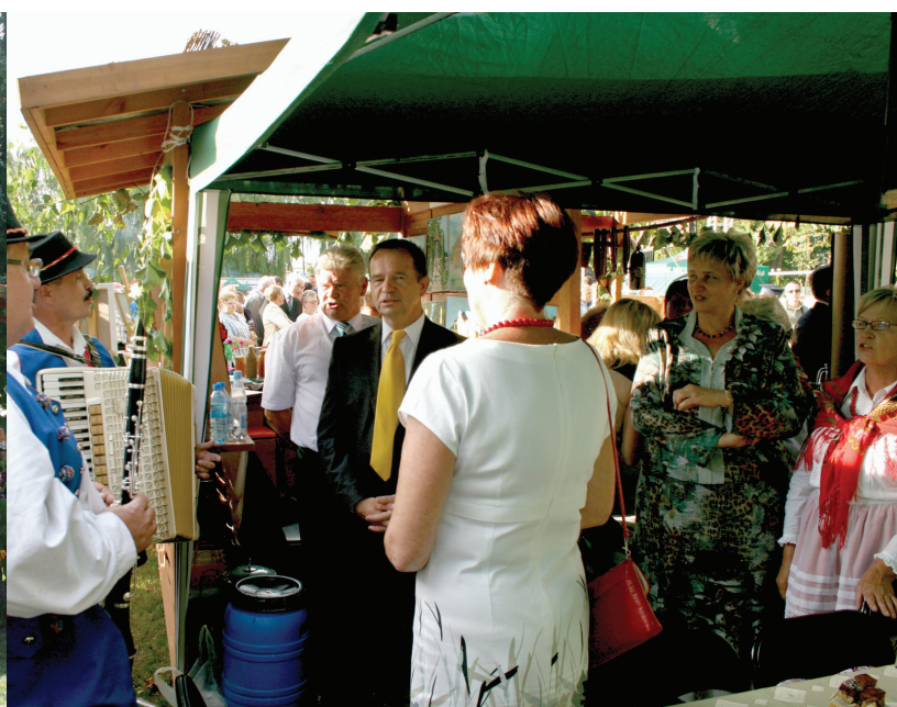
25 sierpnia 2013 - Dożynki Wojewódzkie 2013