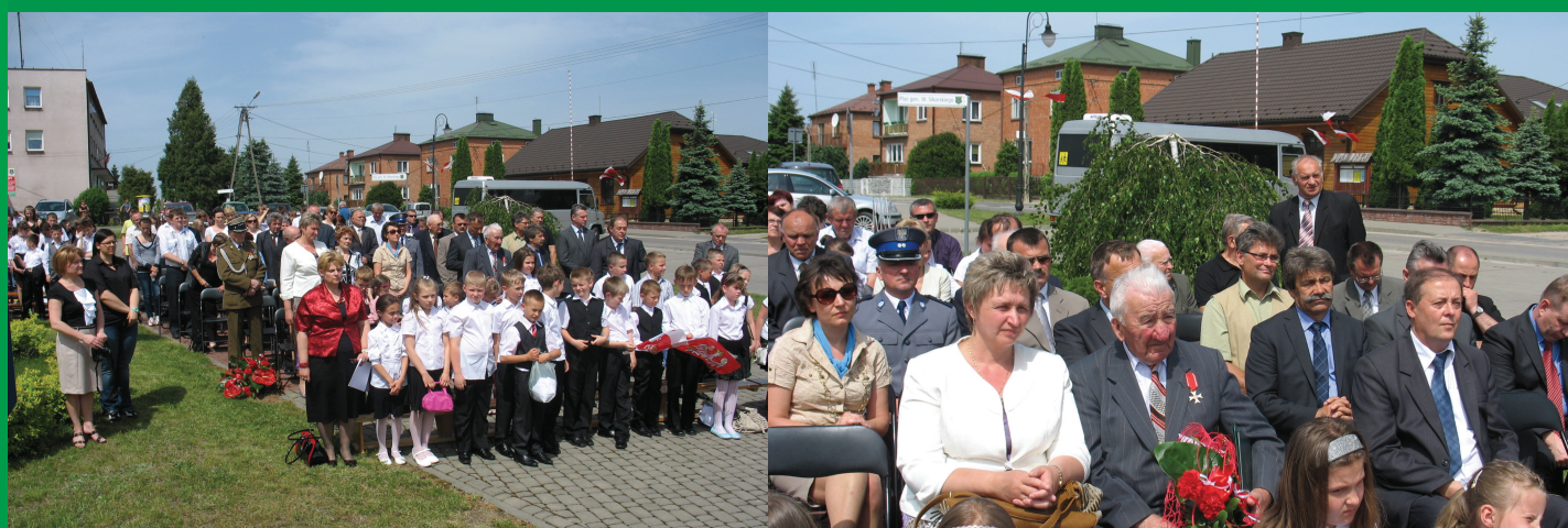
132 rocznica urodzenia gen. Sikorskiego