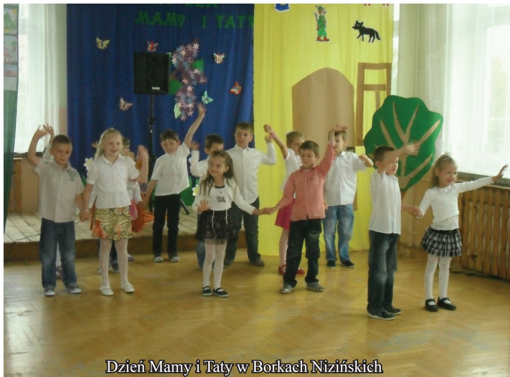
Dzień Mamy i Taty w Borkach Nizińskich