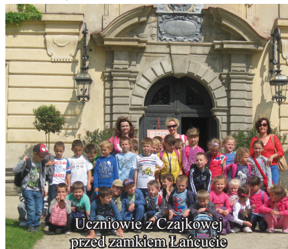
Uczniowie z Czajkowej przed zamkiem Łańcuta

3 czerwca najmłodszy uczniowie Szkoły Podstawowej w Czajkowej z klas 0-III pojechali na wycieczkę do Rzeszowa i Łańcuta. W Rzeszowie dzieci obejrzały spektakl w teatrze „Maska” pt. „ Dziki Łabędzie ” a także uczestniczyły w lekcji teatralnej. Przebywając w Centrum Zbaw „ Fantazja ”, dzieci miały okazję do wspaniałej zabawy i radości. Zwiedzanie zamku w Łańcutie natomiast okazało się piękną lekcją historii oraz było inspiracją do poszerzenia wiedzy.