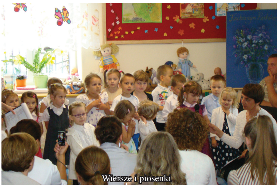
Wiersze i piosenki