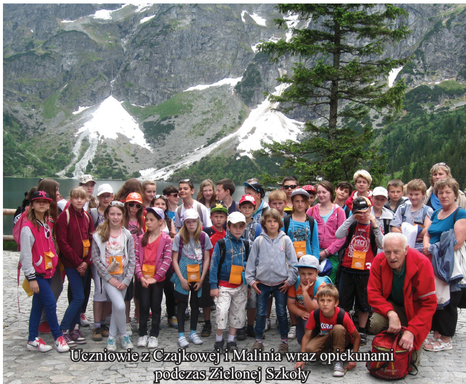
Uczniowie z Czajkowej i Malinia wraz opiekunami podczas Zielonej Szkoły

z zastosowaniem gwary góralskiej. Prezentowane teksty wywoływały wiele uśmiechów i okrzyków radości - co świadczyło o tym, że dzieci doskonale się bawiły. Dużym powodzeniem cieszyły się zajęcia sportowe, a także wspólne gry i zabawy świetlicowe. Wszyscy uczestnicy wyjazdu na Zieloną Szkołę serdecznie dziękują za okazane wsparcie finansowe: