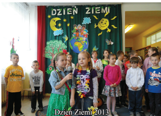
Dzień Ziemi 2013