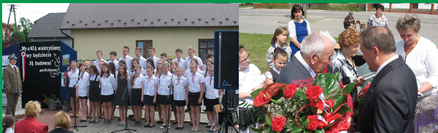
Występ dzieci ze szkoły podstawowej