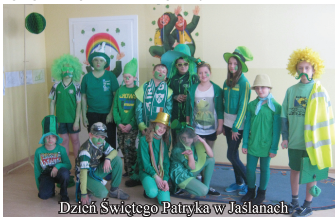
Dzień Świętego Patryka w Jaślanach