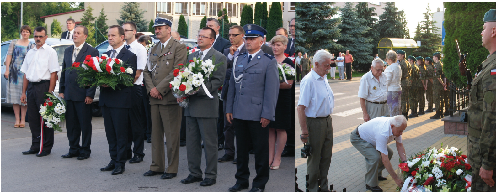
4 lipca 2013 - 70 rocznica śmierci Gen. Sikorskiego