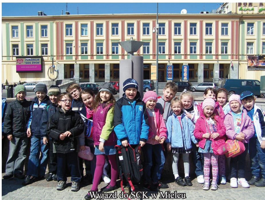
Wyjazd do SCK w Mielcu