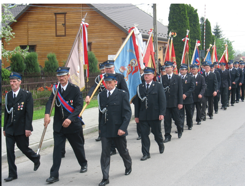
3 maja 2013 - rocznica uchwalenia Konstytucji i Gminne Święto Strażaka