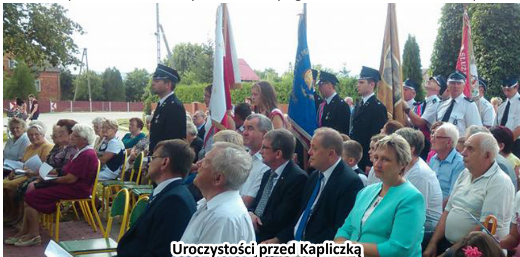
Uroczystości przed Kapliczką