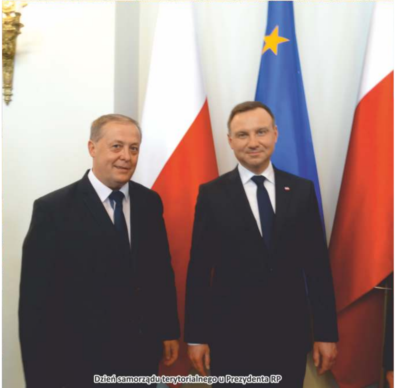
Dzień samorządu terytorialnego u Prezydenta RP

na spotkanie oraz udzielony wcześniej Honorowy Patronat nad uroczystością w dniu 20 maja z okazji 135 rocznicy urodzenia generała Sikorskiego. „Tuszów Narodowy to miejscowość, która od lat realizuje program edukacji historyczno – patriotycznej, w oparciu o Centrum Pamięci generała Sikorskiego, mieszczące się w domu jego urodzenia”- zaznaczył wójt gminy. „O przebiegu uroczystości w Tuszowie Narodowym, ich charakterze i samej miejscowości słyszałem z relacji ministra Kwiatkowskiego”- mówił prezydent gratulując uroczystości.