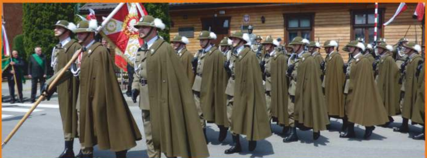
Kompania reprezentacyjna Garnizonu Kraków uświetniająca obchody.