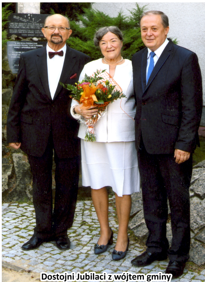
Dostojni Jubilaci z wójtem gminy

Dziękuję również za przykład pięknego życia i pielęgnowanie rodzinnych wartości w myśl nauki kościoła. Życzę również dobrego zdrowia, wszelkiej pomyślności, samych radosnych chwil, błogostawieństwa Bożego oraz kolejnych jubileuszy”.