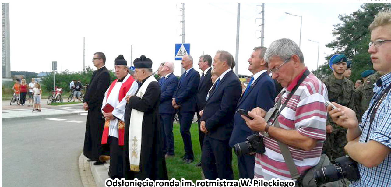
Odsłonięcie ronda im. rotmistrza W. Pileckiego