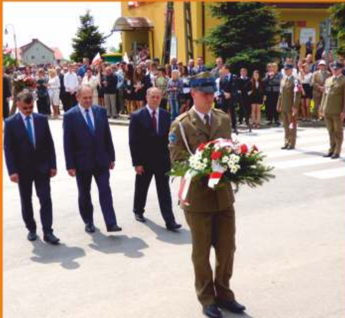
Składanie kwiatów przed pomnikiem gen. W. Sikorskiego