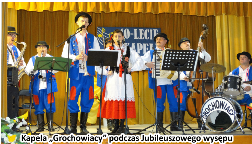
Kapela „Grochowiacy” podczas Jubileuszowego wysepu