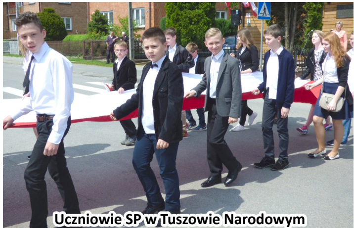
Uczniowie SP w Tuszowie Narodowym