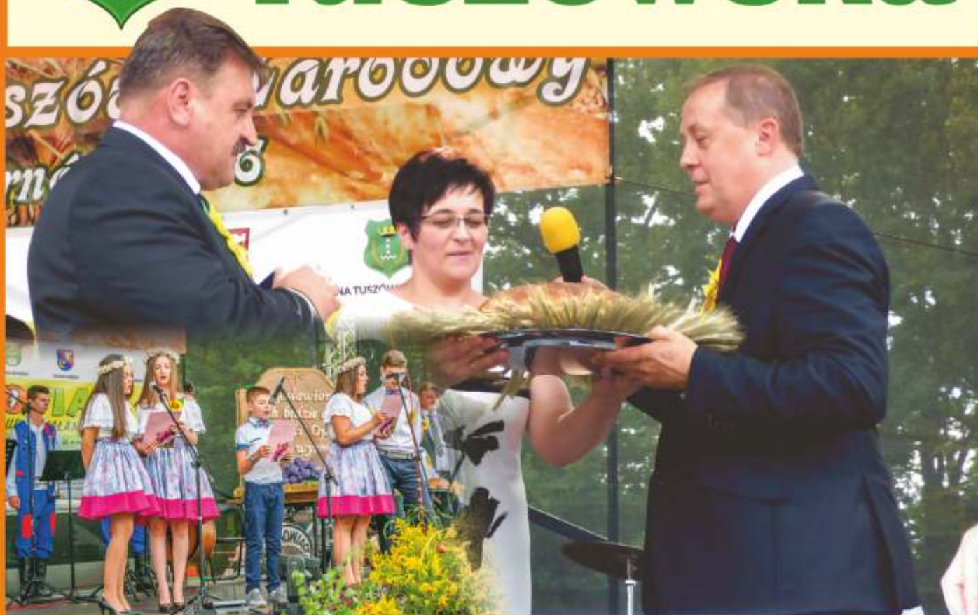
Dożynki Gminy Tuszów Narodowy- Sarnów 2016