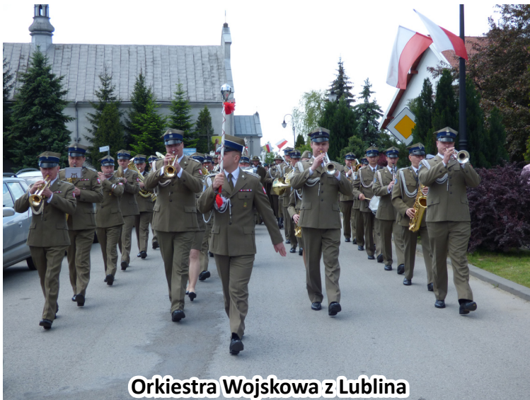
Orkiestra Wojskowa z Lublina

okolicznych gmin, komendanci powiatowi Policji, WKU, PSP, delegacje stowarzyszeń z pocztami sztandarowymi, delegacje licznych instytucji szczebla państwowego i gminnego.