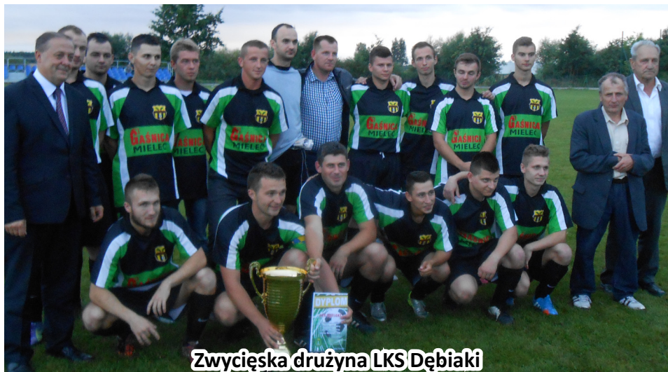
Zwycięska drużyna LKS Dębiaki