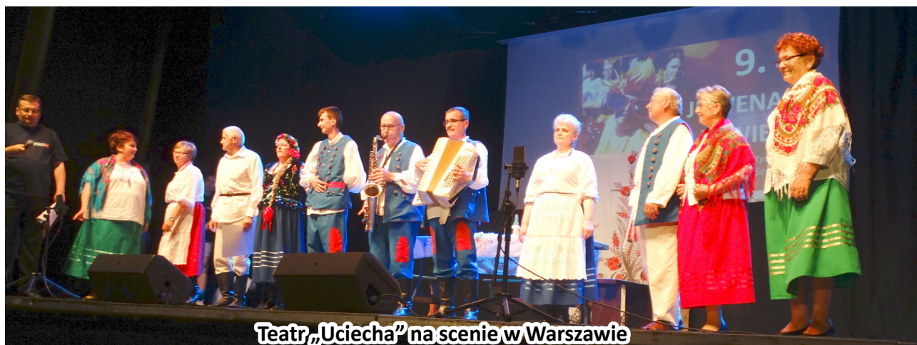
Teatr „Uciecha” na scenie w Warszawie