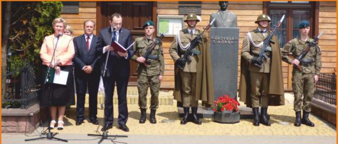
Minister Adam Kwiatkowski czyta list Prezydenta RP skierowany do uczestników obchodów