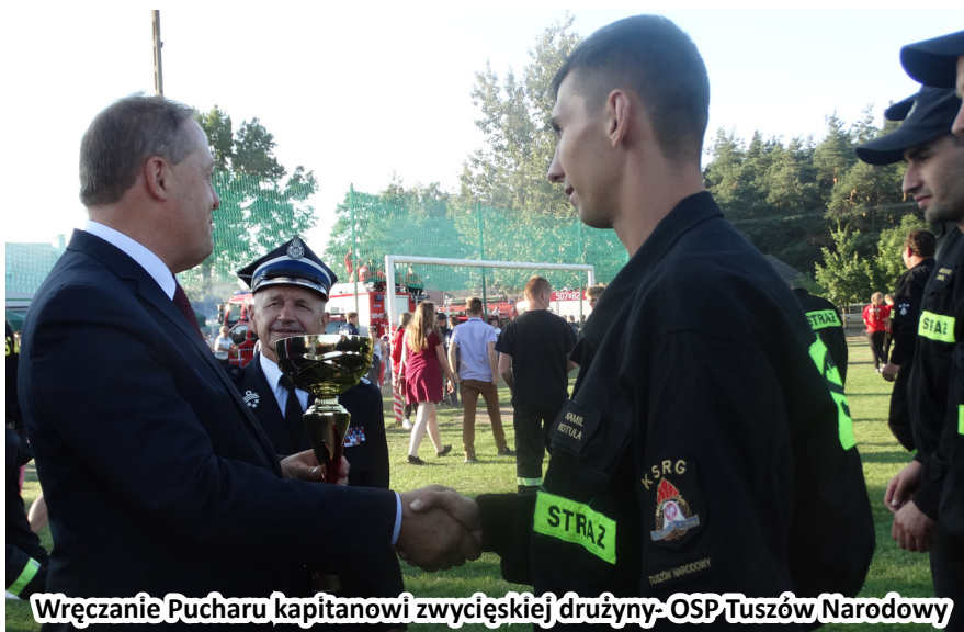
Wręczenie Pucharu kapitanowi zwycięskiej drużyny- OSP Tuszów Narodowy

Jak co roku poziom był wysoki, rywalizacja zacięta, a pogoda sprzyjała zawodnikom. Drużyny walczyły w dwóch konkurencjach: sztafecie pożarniczej z przeszkodami oraz ćwiczeniach bojowych. W kategorii drużyn męskich zwyciężyła jednostka OSP Tuszów Narodowy, która zdobyła