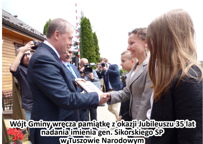
Wójt Gminy wręcza pamiątkę z okazji Jubileuszu 35 lat nadania imienia gen. Sikorskiego SP w Tuszowie Narodowym

Na tuszowskie święto licznie przybyli zaproszeni goście, wśród których byli: Szef Gabinetu Prezydenta Minister Adam Kwiatkowski, Senator RP Zdzisław Pupa, Marszałek Województwa Podkarpackiego Władysław Ortyl, Starosta Powiatu Zdzisław Tymuła, samorządowcy szczebla powiatowego i gminnego, wójtowie