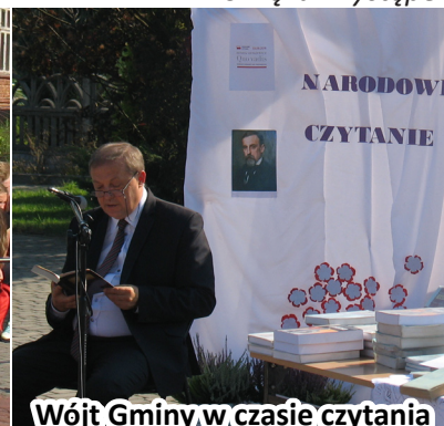
Wójt Gminy w czasie czytania