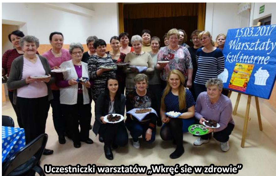
Uczestniczki warsztatów „Wkręć się w zdrowie”