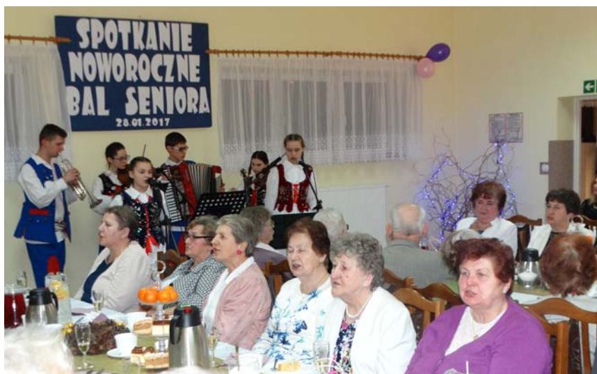
Spotkanie Noworoczne i Bal Seniora 2017