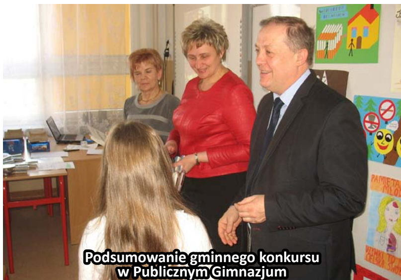
Podsumowanie gminnego konkursu w Publicznym Gimnazjum

W 2016 roku Gminna Komisja Rozwiązywania Problemów Alkoholowych realizowała Program Profilaktyki i Rozwiązywania Problemów Alkoholowych i Przeciwdziałania Narkomanii przyjęty uchwałą Rady Gminy Tuszów Narodowy 30 grudnia 2015 roku.