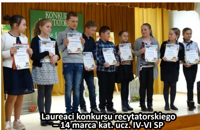
Laureaci konkursu recytatorskiego = 14 marca kat. ucz. IV-VI SP