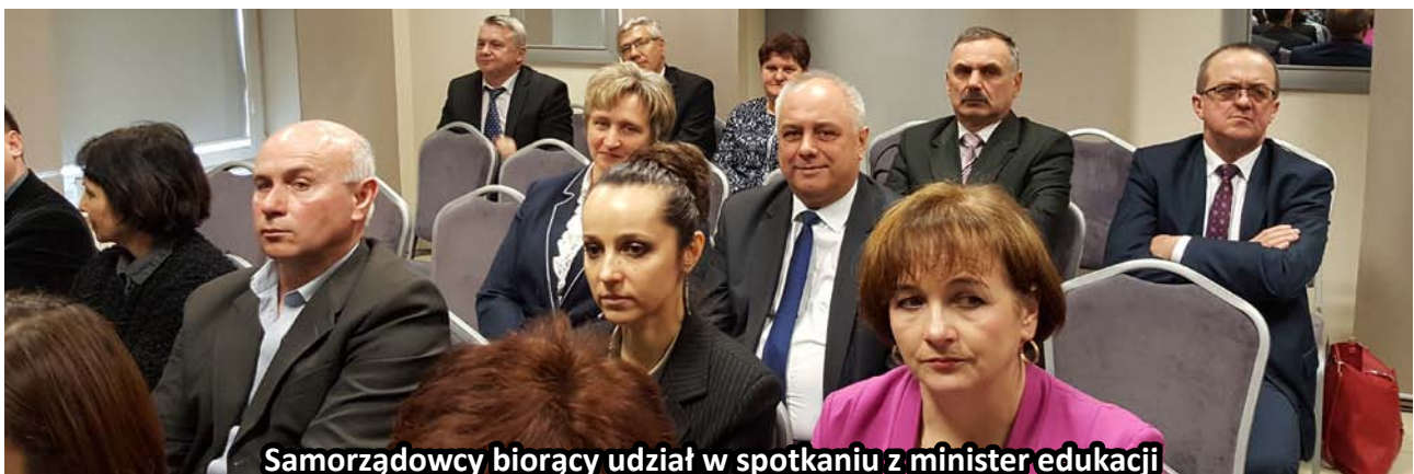
Samorządowcy biorący udział w spotkaniu z minister edukacji

dyskusji podkreślali problemy małych szkół, których subwencja oświatowa nie równoważy kosztów utrzymania. Ponadto poruszona była kwestia zatrudniania nauczycieli wygaszanych gimnazjów i braku godzin pracy dla wszystkich po wprowadzonych przekształceniach. Również zaakcentowany został problem