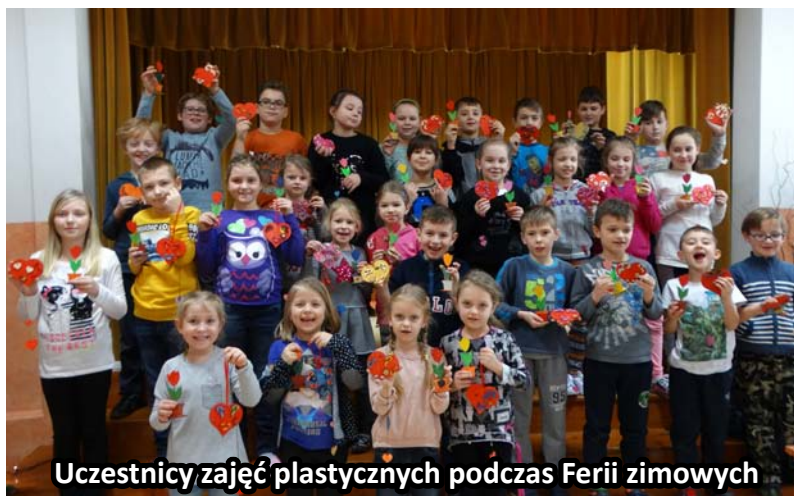
Uczestnicy zajęć plastycznych podczas Ferii zimowych

Każdego dnia podczas zimowych ferii Dom Kultury był pełen zadowolonych dzieciaków, które chętnie korzystały z propozycji naszej placówki. W ofercie znalazły się między innymi zajęcia taneczne, teatralne, modelarskie, plastyczne zawody i rozgrywki sportowo-rekreacyjne a także karnawałowa przygoda disco party oraz wyjazdy do kina.