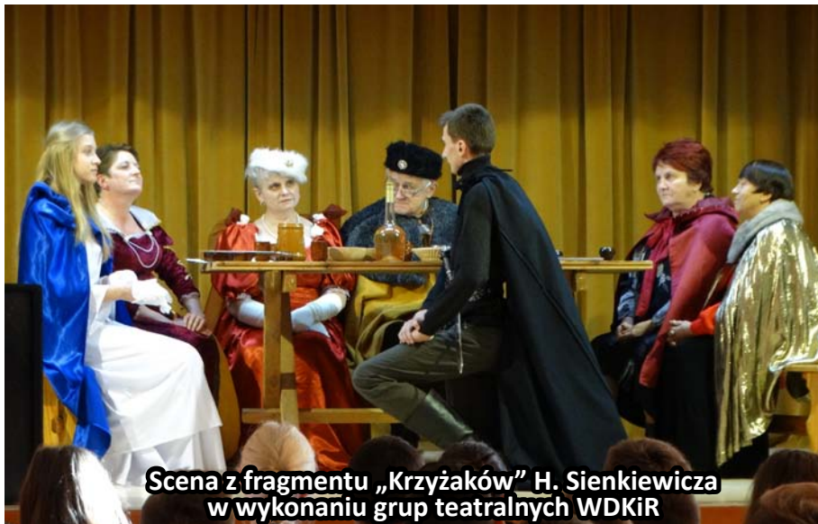
Scena z fragmentu „Krzyżaków” H. Sienkiewicza w wykonaniu grup teatralnych WDKiR