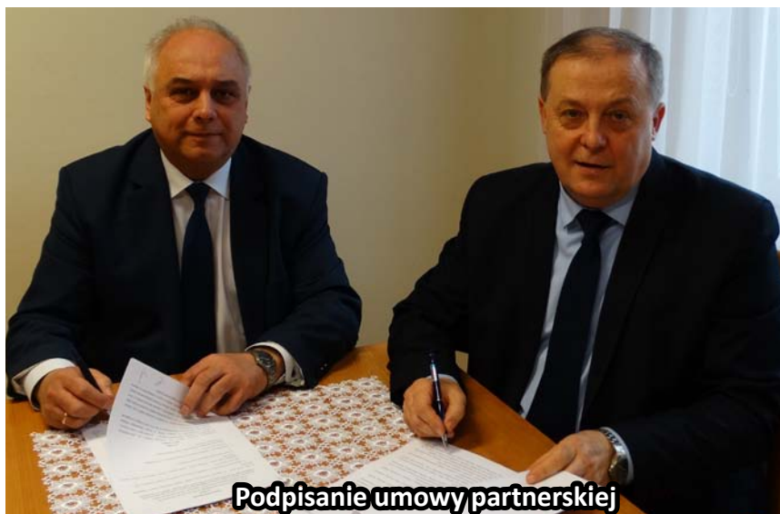
Podpisanie umowy partnerskiej

Partnerstwo Gmin Tuszów Narodowy i Mielec