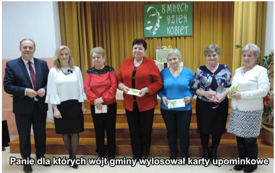
Panie dla których wójt gminy wylosował karty upominkowe