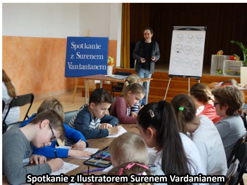
Spotkanie z Ilustratorem Surenem Vardanianem

wanie w twórczość ilustracyjną. Mówił o emocjach i przeżywaniu przygód razem z bohaterami książek, zachęcał do wnikliwszego kontaktu z książką. Następnie rysował tłumacząc jak kreska po kresce