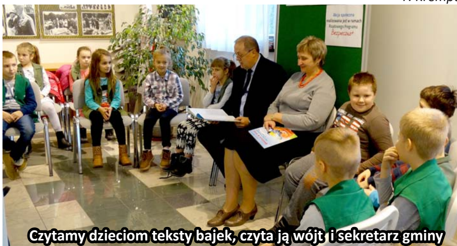
Czytamy dzieciom teksty bajek, czyta ją wójt i sekretarz gminy