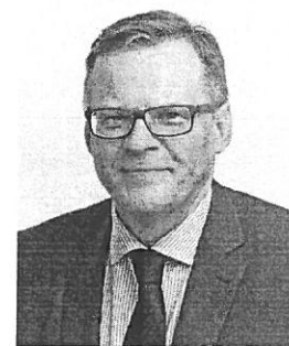
PREZES KASY ROLNICZEGO UBEZPIECZENIA SPOŁECZNEGO